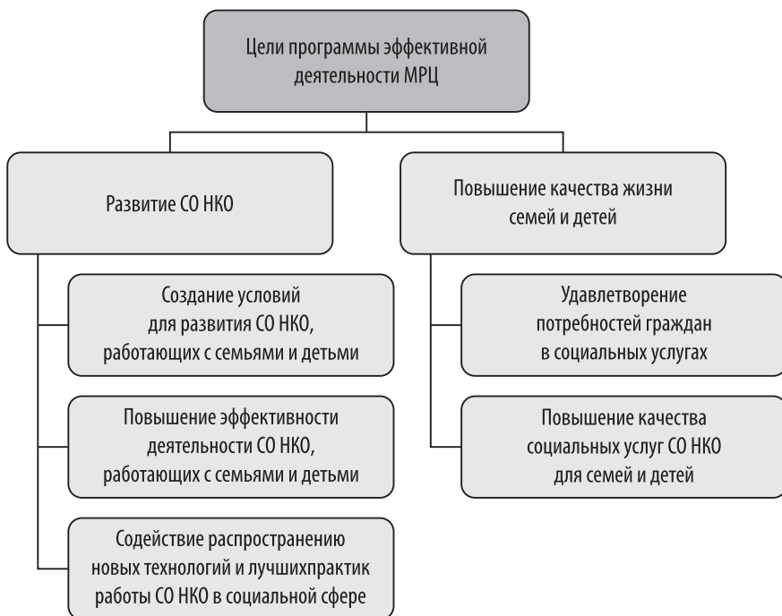
Рис. 2. Цели программы эффективной деятельности межрегионального ресурсного центра поддержки СО НКО, работающих с семьями и детьми, находящимися в трудной жизненной ситуации